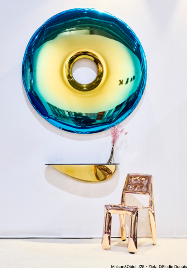
Maison&Objet J25 - Zieta