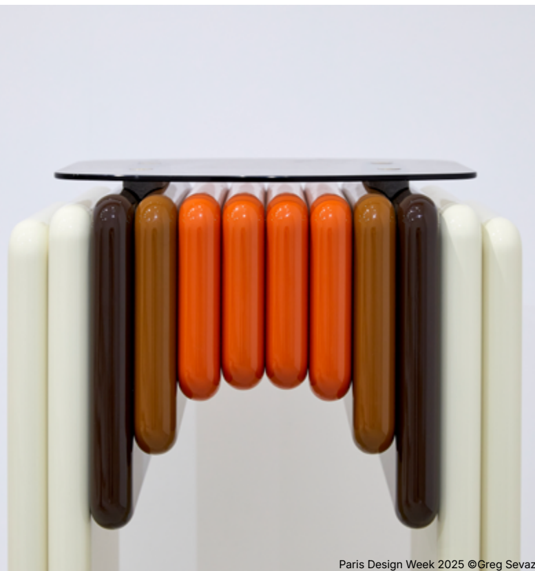
Paris Design Week 2025