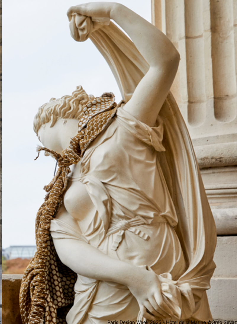
Paris Design Week 2025 - Hôtel de la Marine