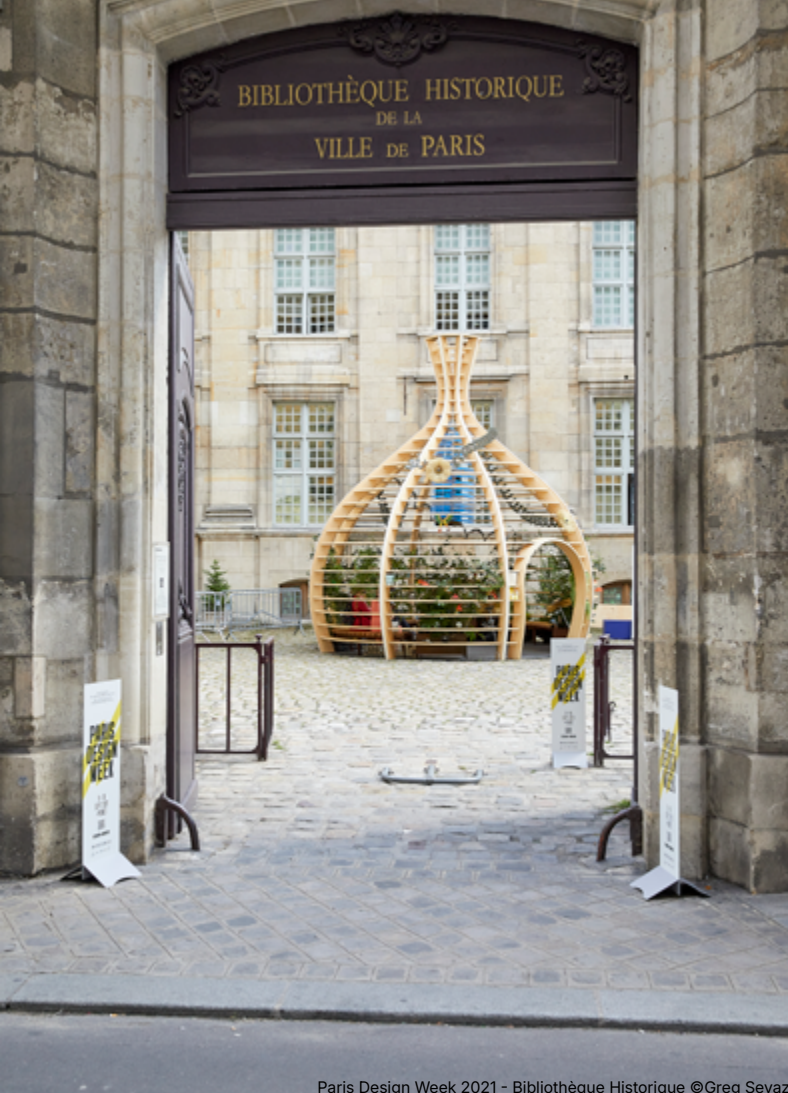
Paris Design Week 2021 - Bibliothèque Historique