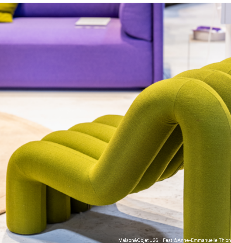
Maison&Objet J26 - Fest