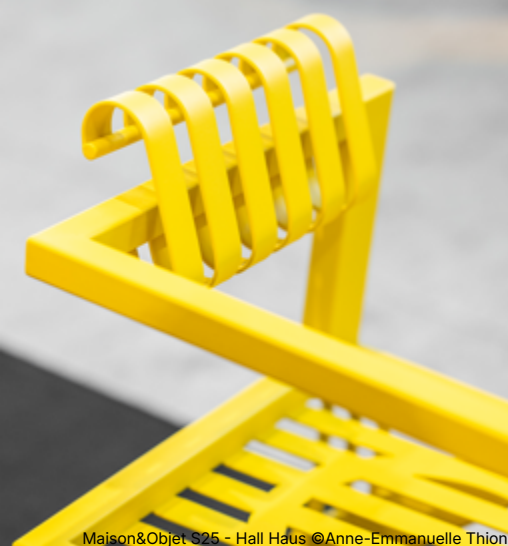
Maison&Objet S25 - Hall Haus