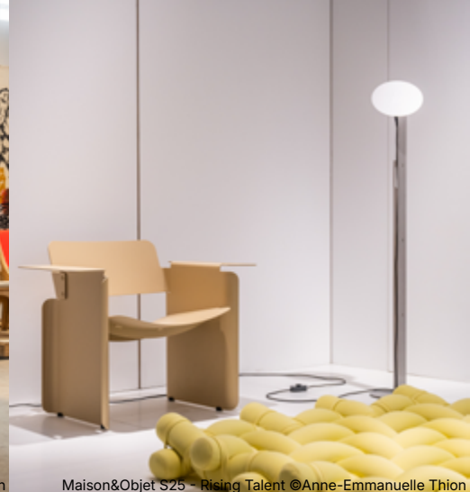
Maison&Objet S25 - Rising Talent