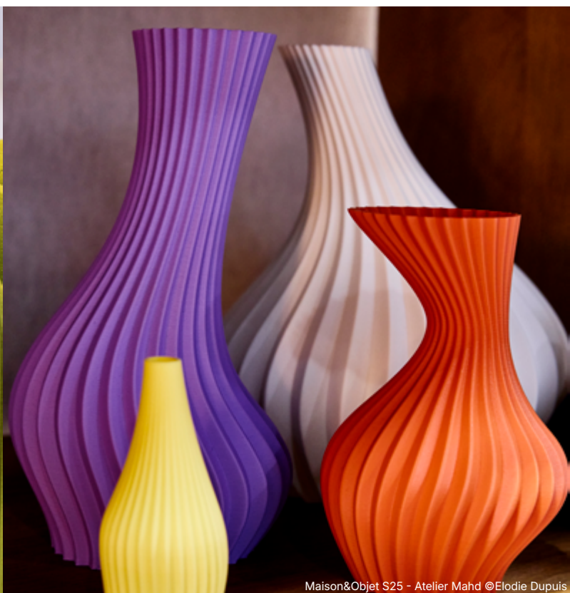
Maison&Objet S25 - Atelier Mahd