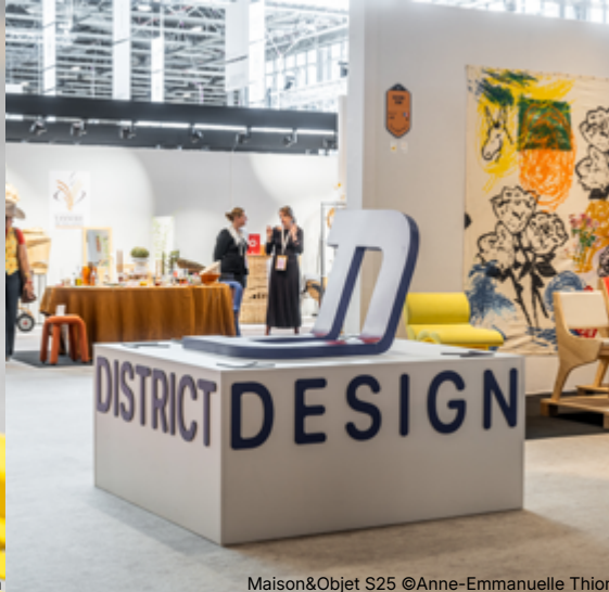
Maison&Objet S25