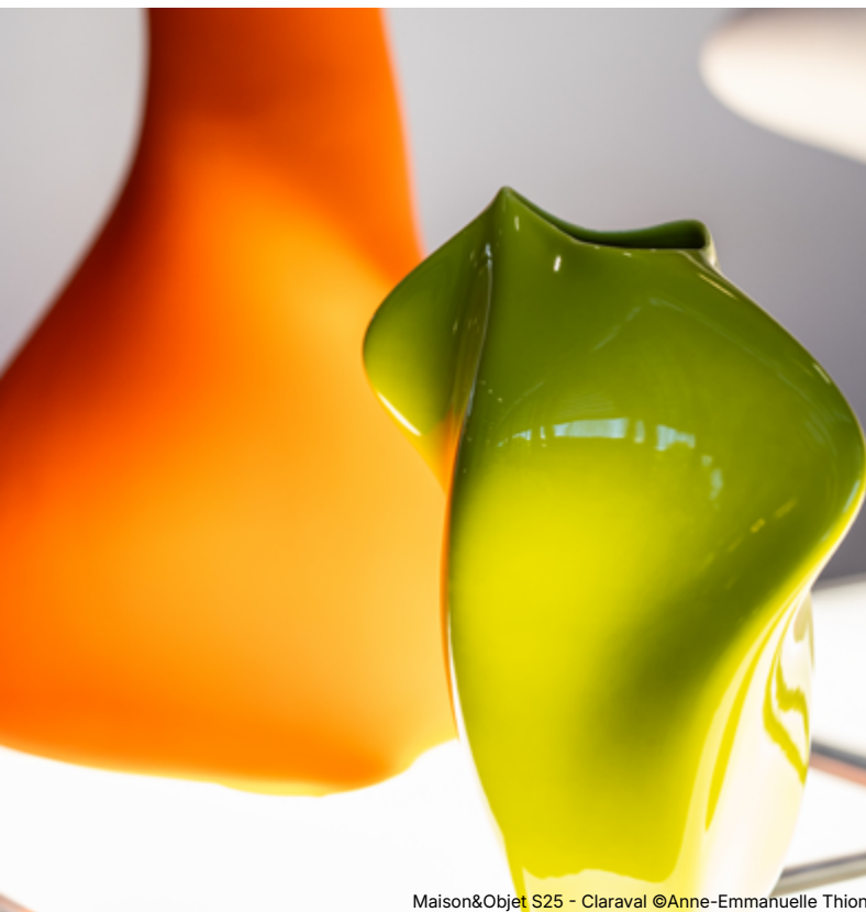
Maison&Objet S25 - Claraval

Es colectiva, compartida, impulsada por una energía común. Un diseño que arrastra, que moviliza, que hace avanzar juntos.