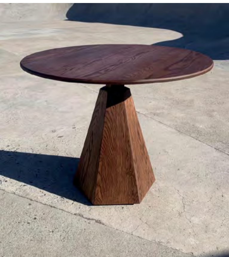
Table : Zinda_Simphiwe Mlambo