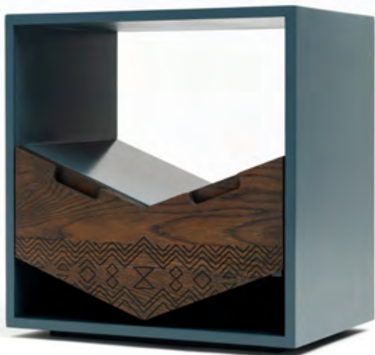
Table de chevet : Mvelo Pedestal_Pinda Interior Design

« Le principal défi est l'accès à la production réelle. Des solutions comme l'upcycling ou des espaces de prototypage dans les écoles pourraient permettre aux étudiants de mieux expérimenter et penser en trois dimensions ».