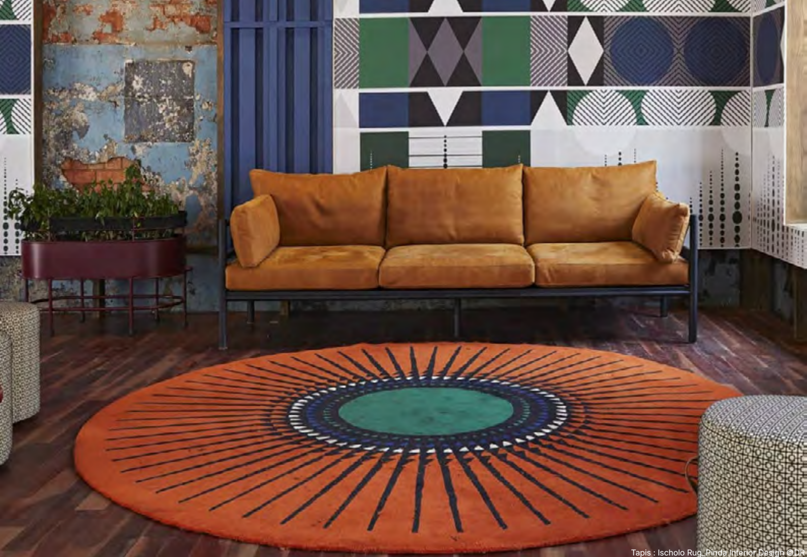
Tapis : Ischolo Rug_Pinda Interior Design