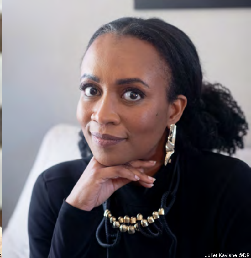
Juliet Kavishe

« Chacun des designers et studios sélectionnés associe, de manière singulière, design contemporain et savoir-faire artisanal. Ils reflètent l'énergie vibrante qui anime actuellement la scène du design sud-africain. »