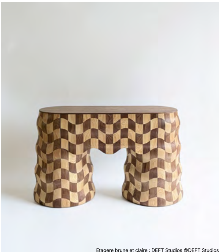
Etagere brune et claire : DEFT Studios

«Un souvenir. Chacune de nos pièces est pensée comme un héritage à transmettre aux générations futures. ».