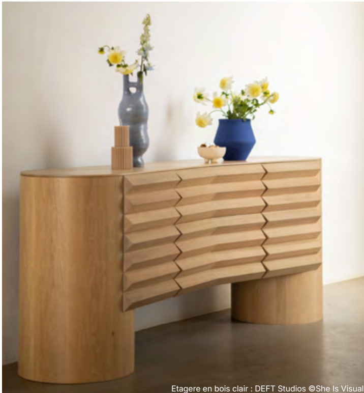
Etagere en bois clair : DEFT Studios

M&O // À contre-courant du « fast furniture », vous défendez un mobilier pensé pour durer, tant sur le plan fonctionnel qu'émotionnel. Comment cette vision façonne-t-elle votre démarche créative et votre positionnement actuel ?