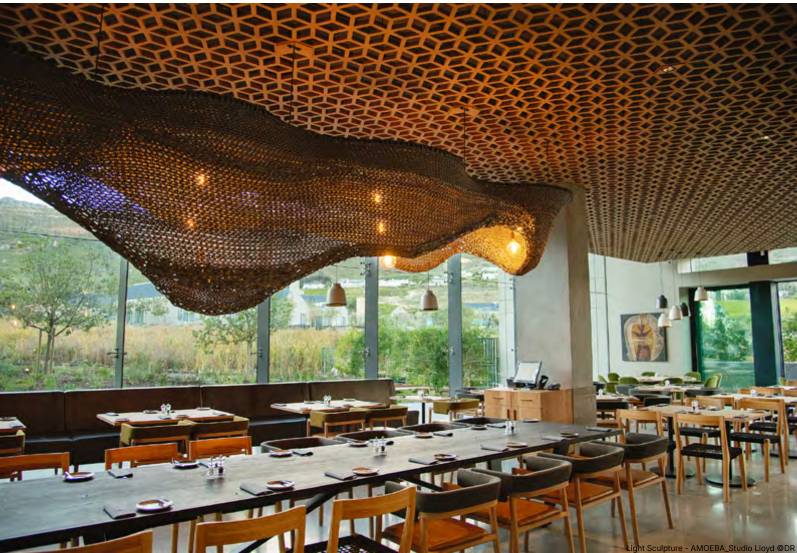
Light Sculpture - AMOEBA_Studio Lloyd ©D

« L'extension des échelles et des usages, notamment à travers des installations lumineuses architecturales de grande ampleur et de nouvelles typologies d'objets. Notre corde traitée anti-UV est tout terrain ! Durable, elle s'adapte aussi bien aux conditions extrêmes, côtières ou désertiques, qu'aux intérieurs les plus raffinés ».