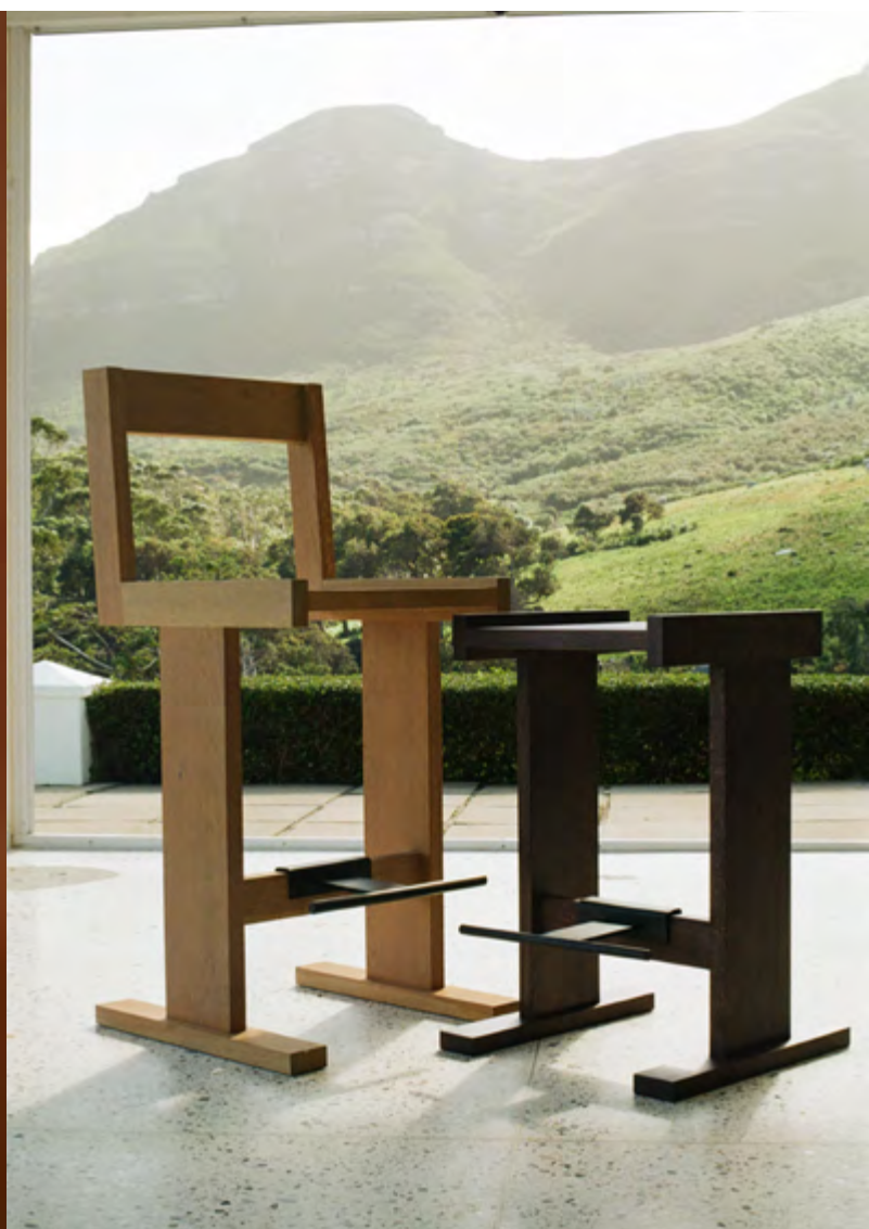
Deux tabourets : G I G I Bar Counter_N I S H