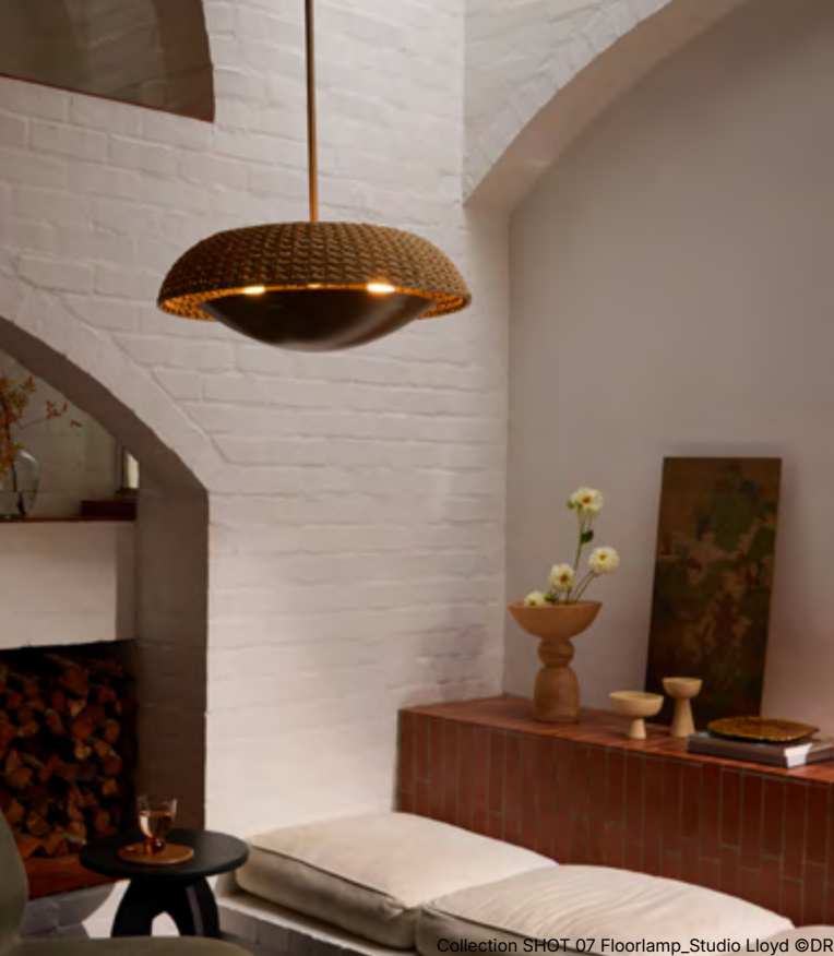
Collection SHOT_07 Floorlamp_Studio Lloyd

M&O // Votre approche créative repose sur l'empowerment. Comment cela se traduit-il dans le fonctionnement quotidien du studio ?