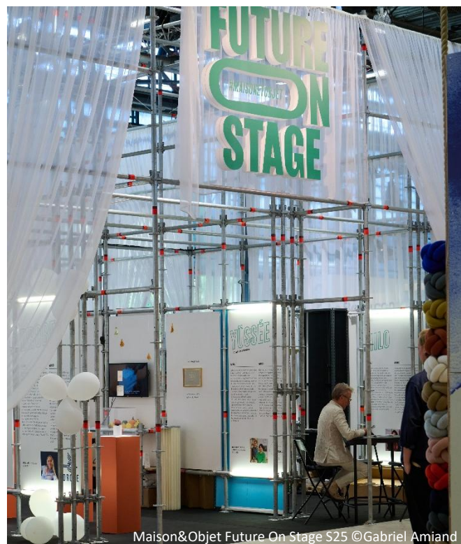
Maison&Objet Future On Stage S25