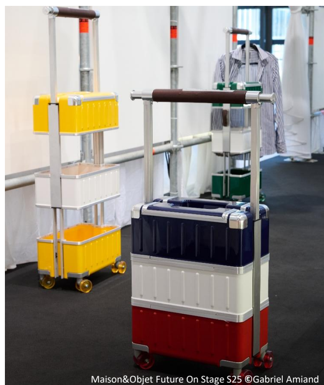
Maison&Objet Future On Stage S25 ©Gabriel Amiard